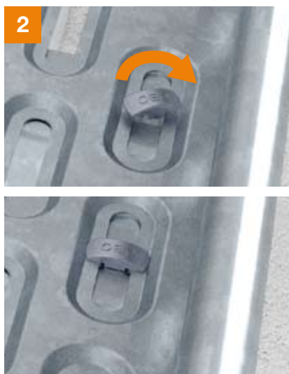
2 Drehen der Schnellbefestigung um 90°