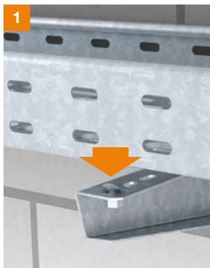
1 Auflegen der Kabelrinne mit der Lochung auf dem Ausleger.

Schraube dauerhaft befestigt. Das bisher zeitaufwändige Verschrauben mit Flachrundschraube und Kombimutter entfällt.