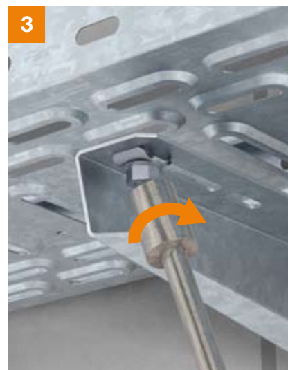
3 Anziehen der Schnellbefestigung